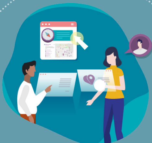
Une solution digitale Ma Boussole Aidants

En premier lieu sur le département de l'Hérault, Ma Boussole Aidants s'insère dans une approche multi-canal et territoriale, avec également un accueil physique dans l' Espace Aidants et le bus itinérant qui sillonne le territoire.